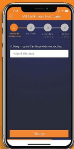
Nhập thông tin số điện thoại