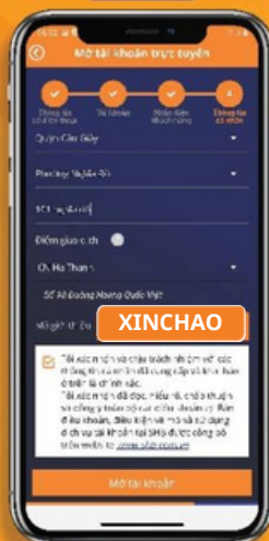
Chọn đơn vị quản lý tài khoản: Nhập mã giới thiệu: XINCHAO