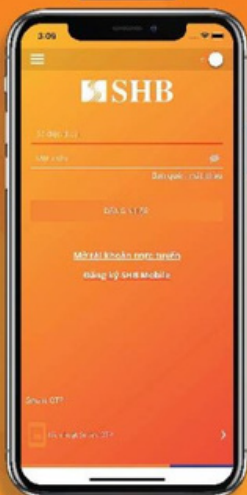
Mở ứng dụng SHB Mobile và chọn "Mở tài khoản trực tuyến"