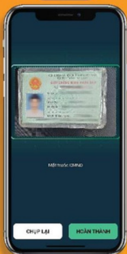
Chụp ảnh giấy tờ tùy thân