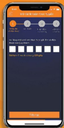
Nhập mã xác thực gửi về điện thoại