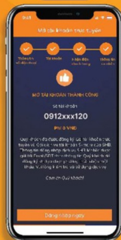
Mở tài khoản thành công ⇒ Đổi mật khẩu ⇒ Vào cài đặt, kích hoạt Smart OTP