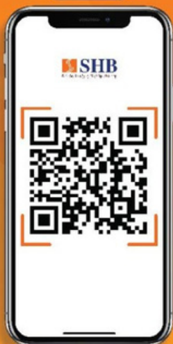
Quét mã QR để tải App SHB Mobile